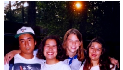
ヒューストンYのメンバーと記念写真