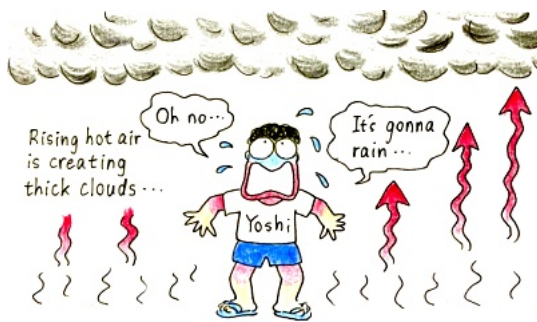
上昇した熱い空気が積乱雲を作っている…