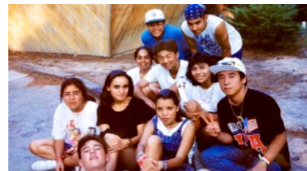
メキシコYのメンバーと記念写真