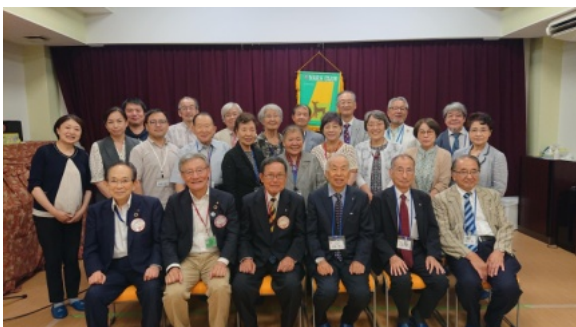
例会後の集合写真