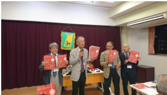
阪和部・中西部合同新年例会のアピール

最後は、ゲスト・ビジターからメッセージをいただき、全員で集合写真を撮り、暖かい盛り沢山の例会となりました。