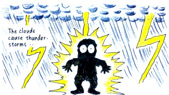
積乱雲が雷雨を引き起こす…