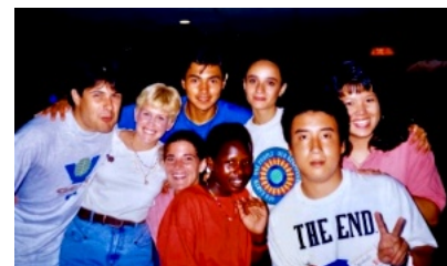
ブラジル、オーストラリア、メキシコ、アメリカ、セネガル、ベトナムYのメンバーと記念写真