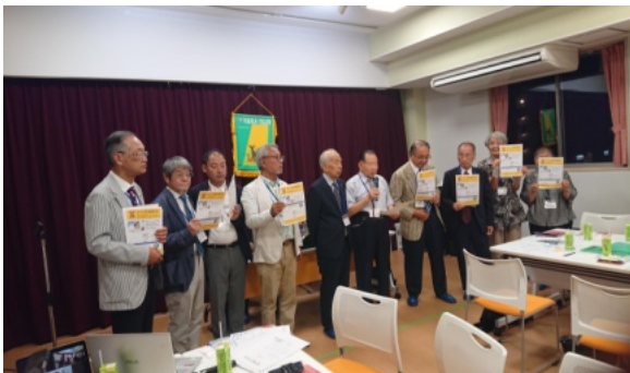
阪和部会のアピール