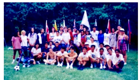
キャンプ場で集合写真