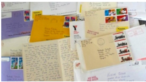
各国の友達から来た沢山の手紙…