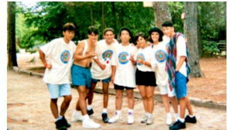
ブラジルYのメンバーと記念写真

当時は携帯電話もメールもなく、日本に帰ってから手書きの手紙で文通をしました。あれから30年、今も何人かとメールやFacebookでやりとりをしています。