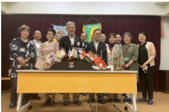
例会後の集合写真