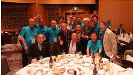
DBC、名古屋東海クラブの皆様とも交流