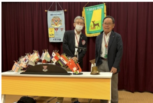
中井会長・林次期会長のツーショット