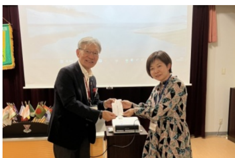
中井会長からお礼