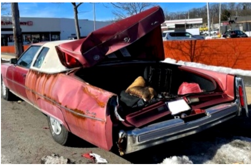
トランクが開まらないキャデラック