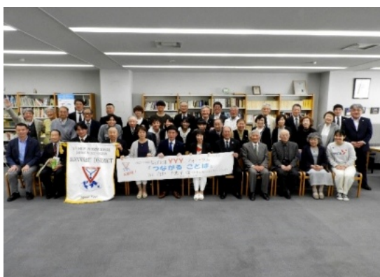
阪和部YYYフォーラム