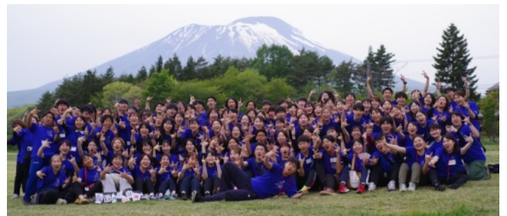
第55回全国YMCAリーダー研修会

今年は、5月4日から6日まで岩手県の国立岩手山青少年交流の家で「第55回全国YMCAリーダー研修会」が実施されました。奈良YMCAからも3名のユースリーダーが参加し、「非常に充実感があり、行って良かった」と報告してくれ、とても良き学びの場となったことかと思えます。これも、奈良ワイズメンズクラブの皆様のご支援のおかげです。ありがとうございます。