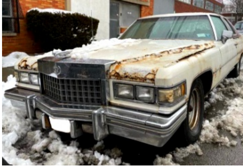
錆びだらけのキャデラック