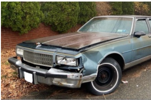
ボンネットの塗装が剥げたカプリス