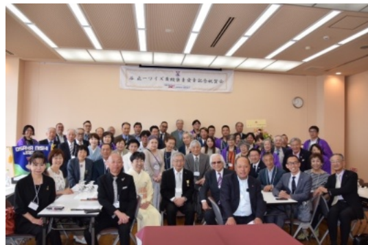
谷ワイズ 黄綬褒章受章お祝い会