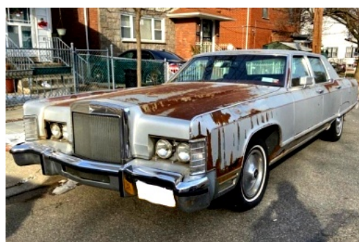
錆びだらけのリンカーン