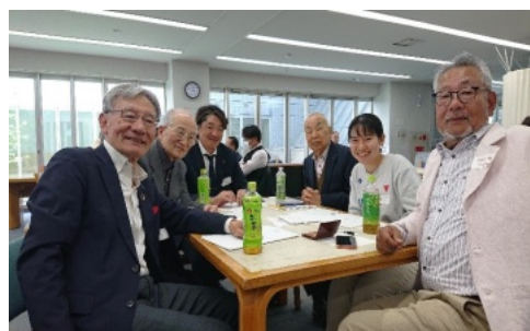
阪和部YYYフォーラム (小グループ)