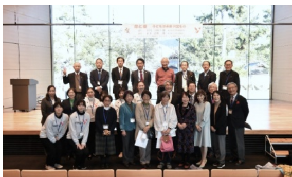
他クラブメンバーもまじえ、メン・メネット勢揃い