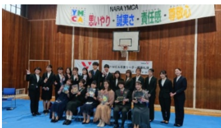
卒Y式／リーダーの皆さん、素敵なお笑顔です