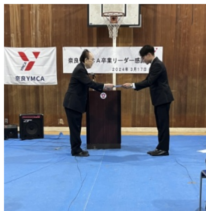
北林メンからお礼