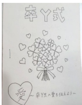
卒Y式／手作りのプログラム

3月3日、奈良クラブは、公開講演会「命と愛・子どもは未来の宝もの」を開催しました。実行委員長として、お役に立てたのかわかりませんが、今はホッとしています。