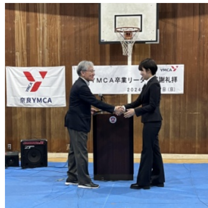
中井会長からお礼