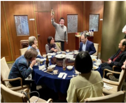
オークションを 開催