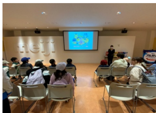
「ウィンタースクール」明治ファクトリー関西

これからも皆様にとって必要なYMCAであり続けたいと願っています。今後も、ご支援よろしくお願い致します。