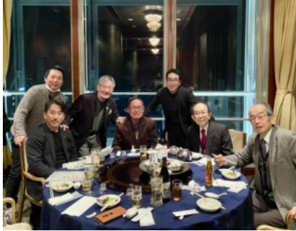
上地総主事を囲んで はい、チーズ