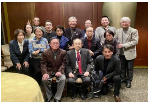
例会後の集合写真