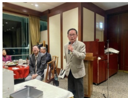
新年例会でのご挨拶