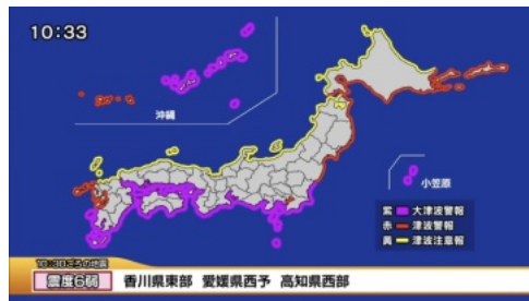
地震発生3分後に全国に津波警報

地震が起きたらどうするか・・・いつでも避難できるよう早めに準備するのが重要です。私も避難用の鞆の中に服装、タオル、洗面用具、マスク、カイロ、水、乾パン、携帯用簡易トイレ、常備薬、ウェットティッシュ、トイレトーパー、通帳、現金、携帯電話用の手回し充電器...等々を詰めました。又、タンス等高い家具は器具で固定しました。