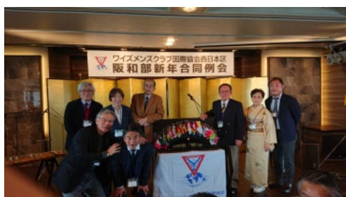
阪和部新年合同例会の参加者

私は1944年1月9日の生まれで今年の誕生日に80歳を迎えました。80歳は長寿の目標としておりましたので心身共に健やかに迎えられたことを素直に喜び、周囲の人々の心遣いに感謝をしております。そして、人生仕上げ期の“八十路”をスタートするのですが、健康や体力面の衰えと物忘れ、置忘れや記憶力の低下等、頭脳の老化に対する不安は拭えません。