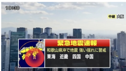
南海トラフ巨大地震の緊急地震速報 (シュミレーション映像です)