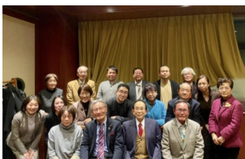
例会後の集合写真