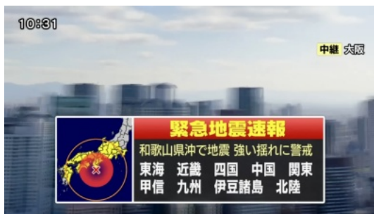
大阪市内の中継...めっちゃ揺れてます