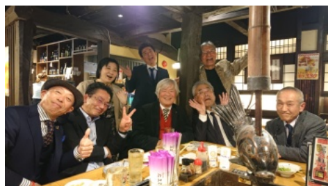
中西部新年合同例会/他クラブの皆様との交流