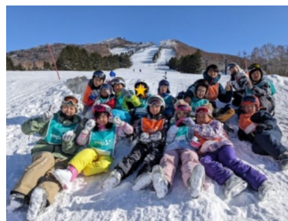
志賀高原スキーキャンプ

これからも皆様にとって必要なYMCAであり続けたいと願っています。今後も、ご支援よろしくお願い致します