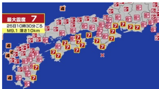
震度7...九州や中部にも広がっています